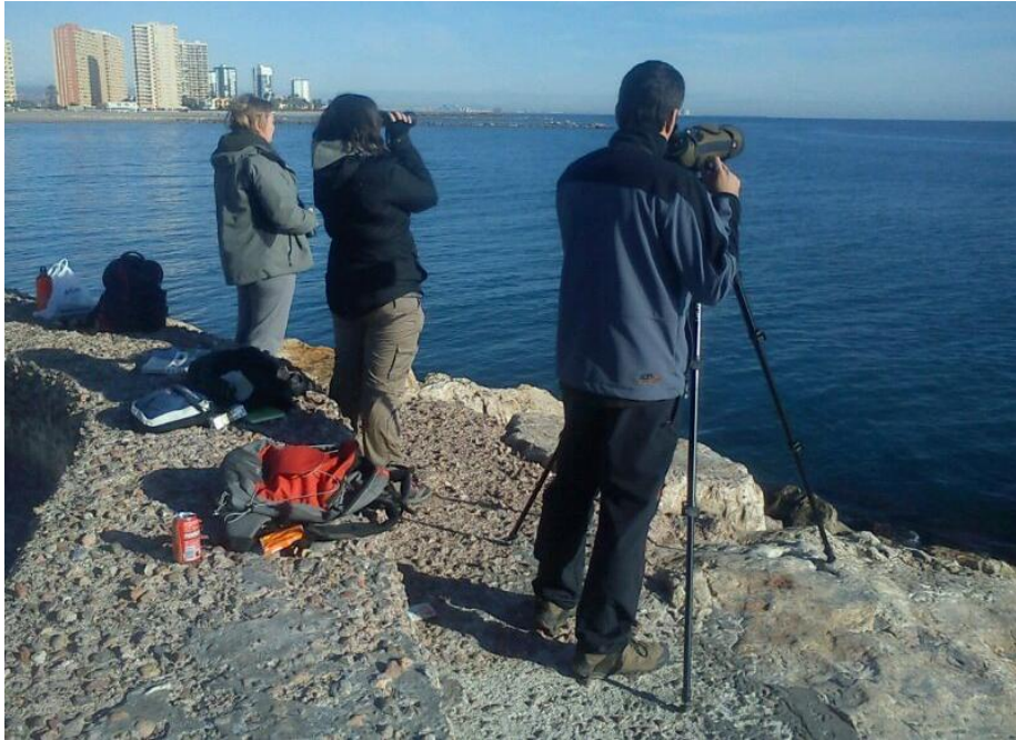
La Pobla de Farnals.