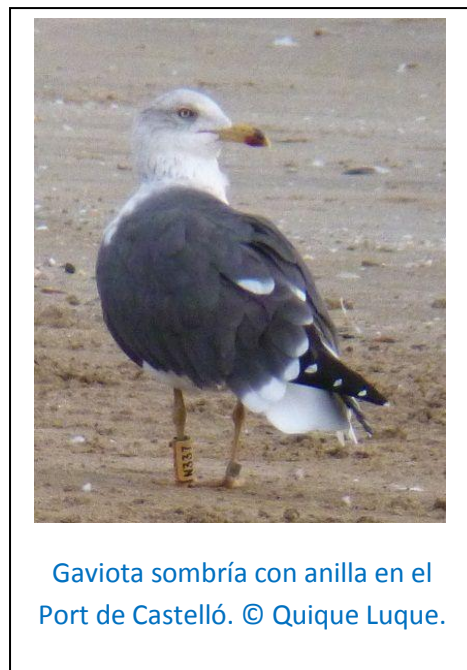
Gaviota sombría con anilla en el Port de Castelló.

La gaviota picofina ( Larus genei ) fue la más escasa, con solo 10 ex. repartidos entre los dos puntos de censo más al sur, Desembocadura del Vinalopó (8 ex.) y Cap Cervera (2 ex.).