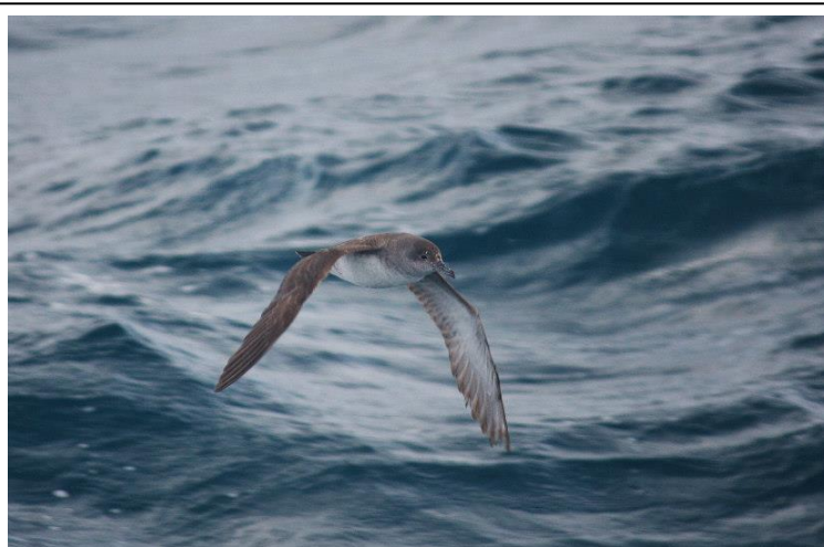
Pardela balear.

El presente censo registró un total de 3.764 ex de pardelas baleares, lo que supone una tendencia descendente que ya dura cuatro años. De hecho, es el 40% de las observadas en el año 2010, cuando se anotó la cifra récord desde que se viene haciendo el CAMILCV y que fue de 9.319 ex.