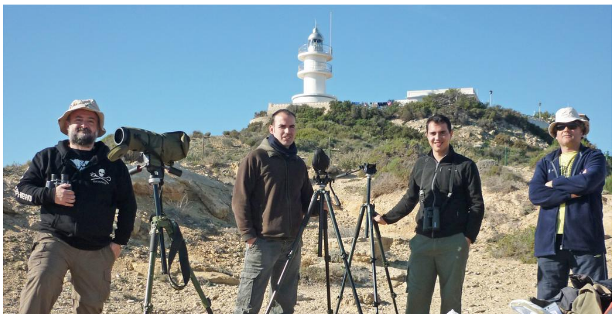
Cap de l'Horta.