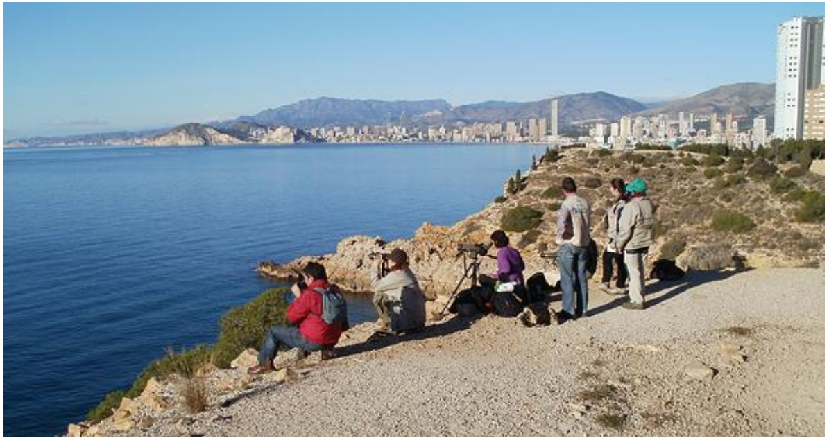
PN Serra Gelada.

Gens aus marines 2013 Torre Xarco la Vila joiosa Xoriguer i Club Nautic La Vila