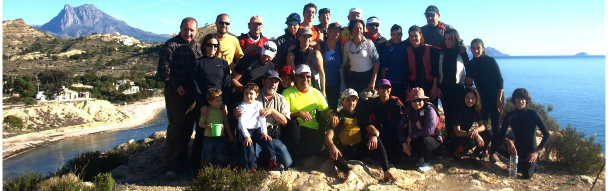
Torre del Xarco.

Gens aus marines 2013 Torre Xarco la Vila joiosa Xoriguer i Club Nautic La Vila