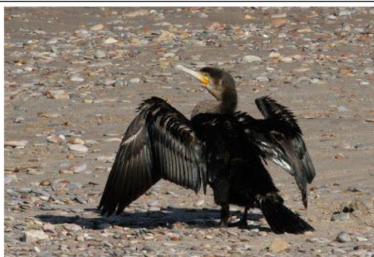
Cormorán grande en El Saler.