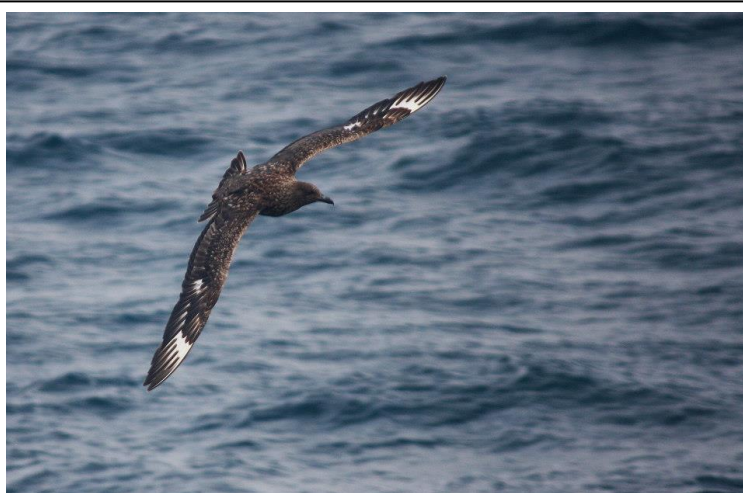
Págalo grande.